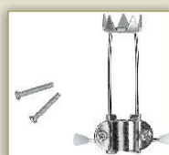
Eiskralle Artikel 146600