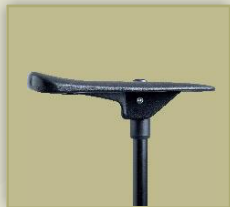
Sitzlänge ca. 23 cm