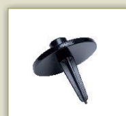
Spikeaufsatz Artikel 8205