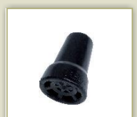
Ersatzfüße Artikel 8201