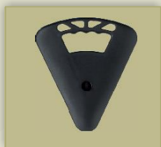
Sitzbreite ca. 20 cm