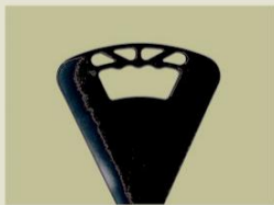
Sitzbreite ca. 20 cm