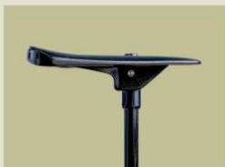
Sitzlänge ca. 23 cm